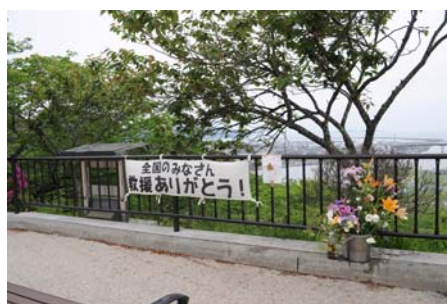
被災地からのメッセージ

診察台のない避難所での治療は非常に困難でしたが、現地の歯科医師、歯科衛生士、保健師さん達の協力もあり、無事義歯修理・調整、口腔ケア等の歯科支援を行うことができました。