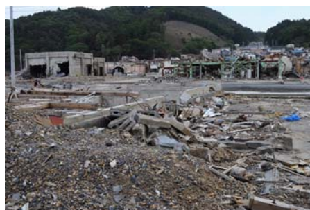
がれきが散乱している女川町内